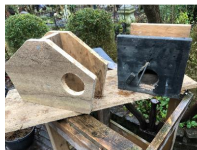
Links de sluis, rechts de pendel

Helaas wordt er nog wel eens een marter in een nestkast aangetroffen; een keer sprong er zelfs een marter uit toen we de kast open maakten. In één van de vorige nieuwsbrieven (oktober 2022, blz. 6, klik hier ) hebben we bericht over het vervangen van de 'pendel' in de nestkasten door 'sluisjes'. Dat hebben we tot nu toe vooral in ons westelijke gebied gedaan omdat daar de 'marterdruk' hoog was. Dit blijkt in de praktijk goed te werken om insluipen door marters te voorkómen. Wezels en hermelijnen zijn kleiner dan marters, helaas houdt een sluisje hen niet tegen; deze dieren zijn zo klein en flexibel dat ze in iedere nestkast kunnen binnendringen.