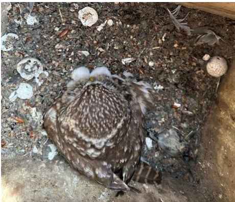
Steenuiljongen onder hun moeder

Elk jaar is weer anders, dat bleek ook dit jaar. Soms treffen we erg veel eieren en legsels aan, waarbij we dan de aanname maakten dat er blijkbaar veel voedsel beschikbaar was en het een heel goed jaar leek te worden. Maar in de jongenfase kwamen we dan bijvoorbeeld weer weinig voedsel in de kasten tegen, niet bebroede of verlaten eieren. Soms waren er grote gewichtverschillen tussen het kleinste en het grootste jong. In een enkel geval was het verschil zo groot dat we ook het ringen moesten faseren en moeten bijvoeren.