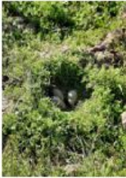
Wulp op bouwland

maaien zoveel mogelijk te voorkomen. Dat heeft gewerkt en we zagen op een gegeven moment een groot jong onbevreesd midden tussen de kraaien en roeken rondstappen.