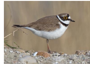
Kleine Plevier

In 2021 heeft ons lid Mark Lieverdink tellingen en nestregistraties uitgevoerd in en om het projectgebied. De resultaten waren ver boven verwachting. Met name de Kieviet met rond de 35 nesten, maar ook de gele kwikstaart, tureluur en kleine plevier waren boven verwachting vertegenwoordigd. Van de 5 nesten van de (beschermd) kleine plevier zijn in 3 nesten jongen groot gebracht.