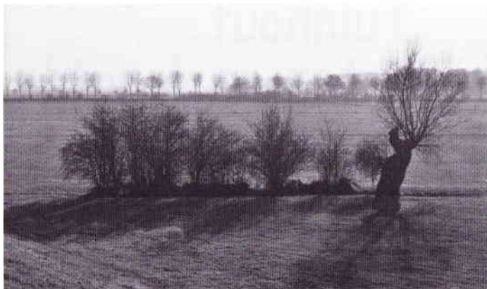
Struweelhaag in de uiterwaarden bij Bronckhorst.

Vaak worden de termen heggen en hagen door elkaar gebruikt en regionaal hebben ze soms verschillende betekenissen. De term heg gebruiken we voor strak geschoren elementen, de term haag gebruiken we voor de breed en hoog uitgroeiende elementen. Een voorbeeld van heggen zijn de meidoornheggen rond de verschillende boomgaarden in beheer bij