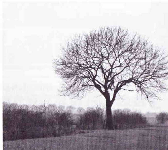
Struweelhaag in de uiterwaarden bij Bronckhorst.

Leggen gebeurt door het inhakken en ombuigen van een hele struik. Meer informatie over vlechtheggen kunt u vinden op de website www.heggen.nu . Het Steenders Landschap zal