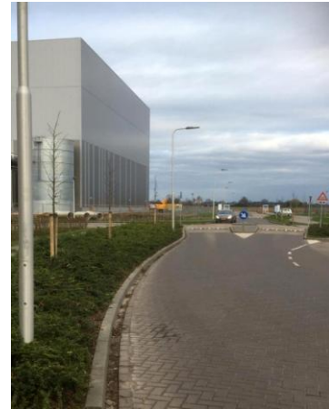
Ariensstraat: 9 nieuwe bomen