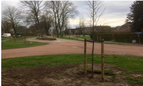
Bronkhorsterweg: 11 nieuwe bomen

Op basis van het advies heeft de gemeente recent nieuwe bomen geplant langs de invalswegen van Steenderen: vanuit Olburgen 5 bomen, vanuit Bronkhorst 11 bomen, vanuit Toldijk 1 boom, vanuit Baak 9 bomen en bij het zwembad en de Pannevogel 10 bomen.